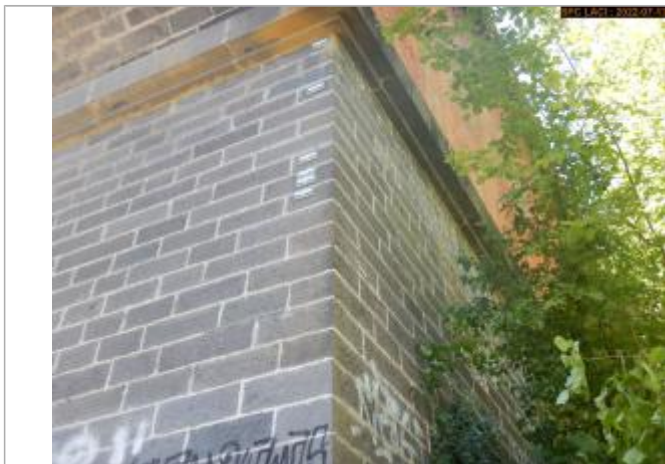
Vue du repère éloignée