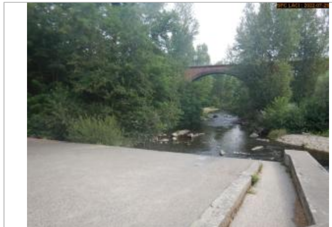
Vue par l'amont du site éloignée