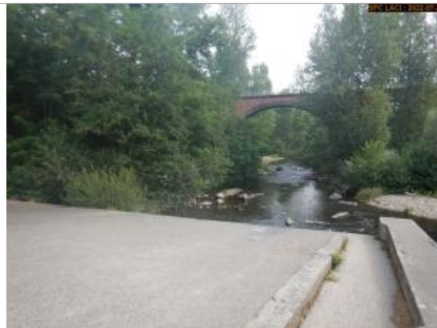
Vue par l'amont du site éloignée