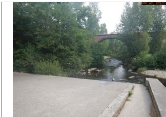
Vue par l'amont du site éloignée