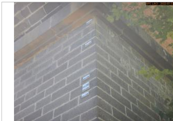
Vue du repère éloignée