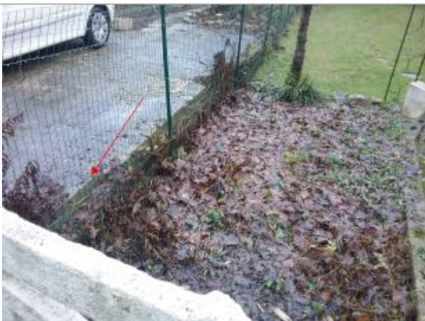
Vue de la marque

Altitude calculée de l'eau (en m) : 49.5 m