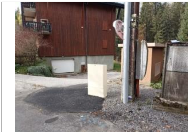
Résidence des Nants