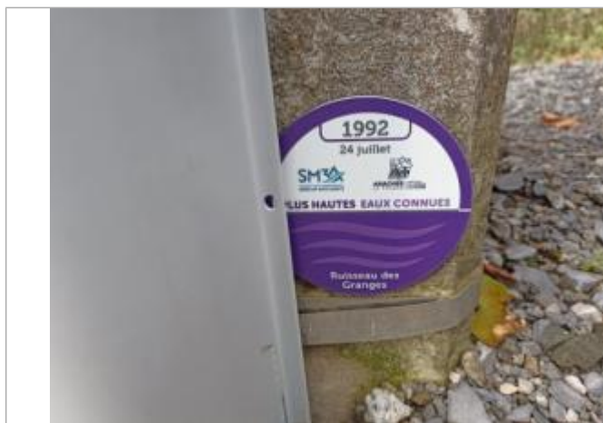
crue du ruisseau des Granges le 24 juillet 1992