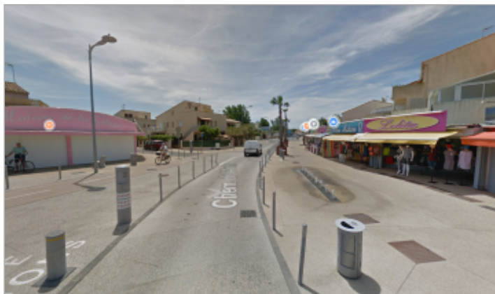
Place commerçante vue depuis l'accès nord.