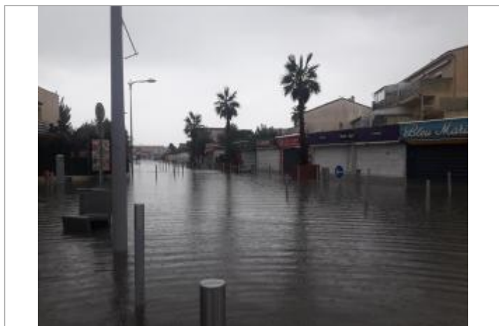
Vue de la rue en direction du sud