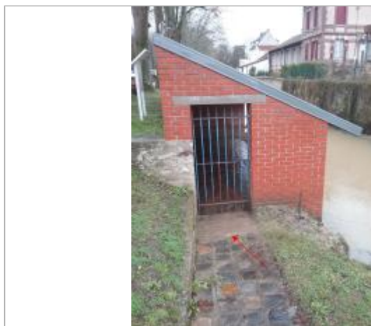
Vue de la marque

Altitude calculée de l'eau (en m) : 49.6 m