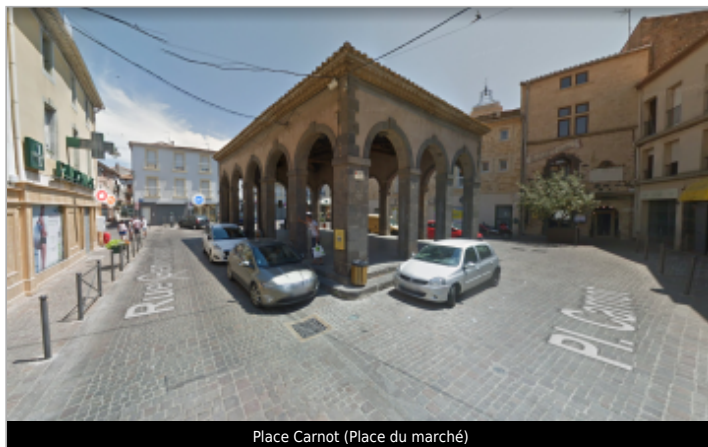
Place Carnot (Place du marché)