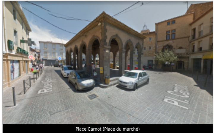
Place Carnot (Place du marché)

Coordonnées WGS84 : X: 3.52796880 / Y: 43.35600400