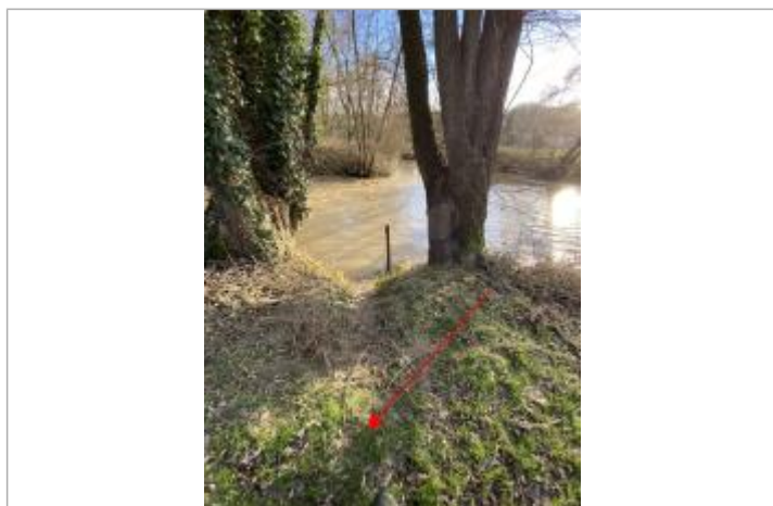
Vue de la marque

Altitude calculée de l'eau (en m) : 62.02