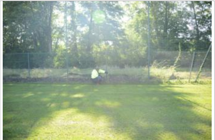
Vue d'ensemble de la laisse de crue sur grillage

GÉOLOCALISATION Coordonnées WGS84 : X: 0.08681555 / Y: 48.41801740 Coordonnées RGF93 (Lambert 93) : X: 484498.77 / Y: 6817056.95 Coordonnées RGF93 (ETRS89) : X: 0.0868156 / Y: 48.4180174