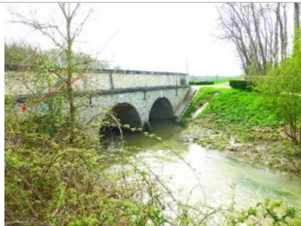
Vue site