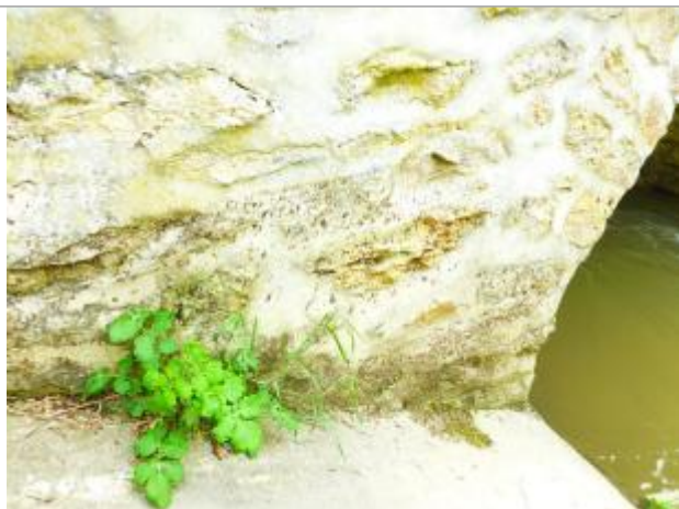
Vue marque - Auteur : SPC SMYL