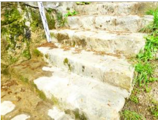
Vue marque - Auteur : SPC SMYL