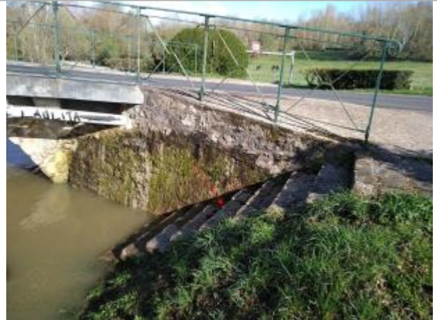
Vue site