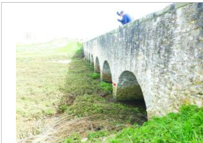
Vue marque - Auteur : SPC SMYL