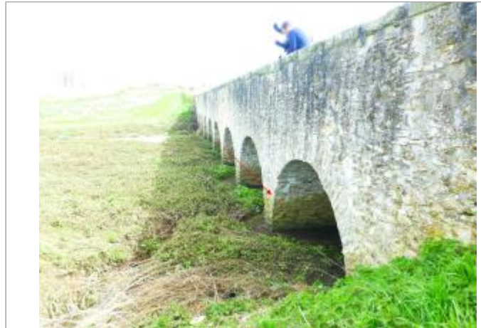
Vue site