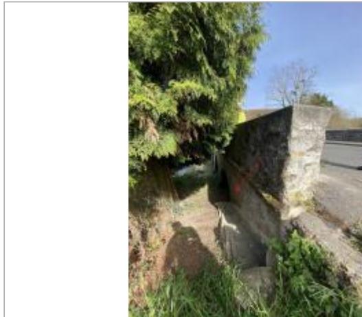
Vue site

Coordonnées WGS84 : X: 2.91957650 / Y: 48.55734600