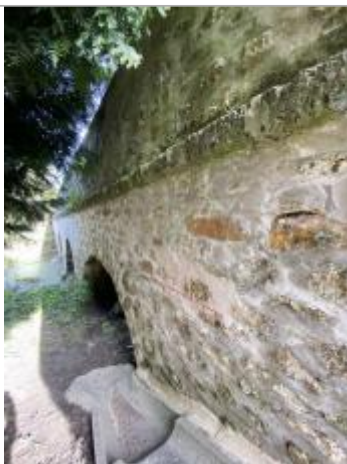
Vue marque - Auteur : SPC SMYL

Altitude calculée de l'eau (en m) : 94.05 m