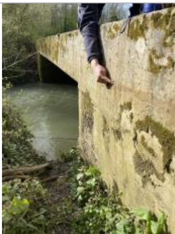
Vue marque - Auteur : SPC SMYL