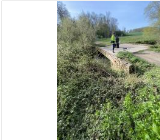
Vue site

Coordonnées WGS84 : X: 2.93390090 / Y: 48.56001830