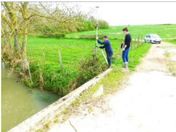
Vue marque

Altitude calculée de l'eau (en m) : 63.558