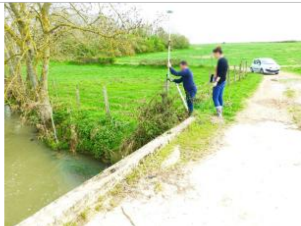
Vue site - Auteur : SPC SMYL