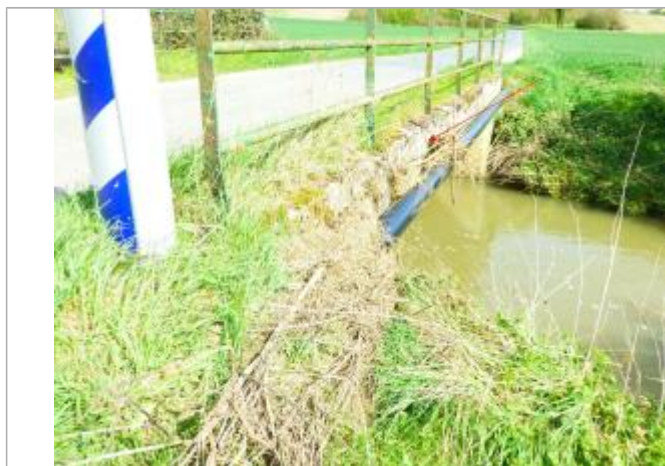
Vue marque - Auteur : SPC SMYL