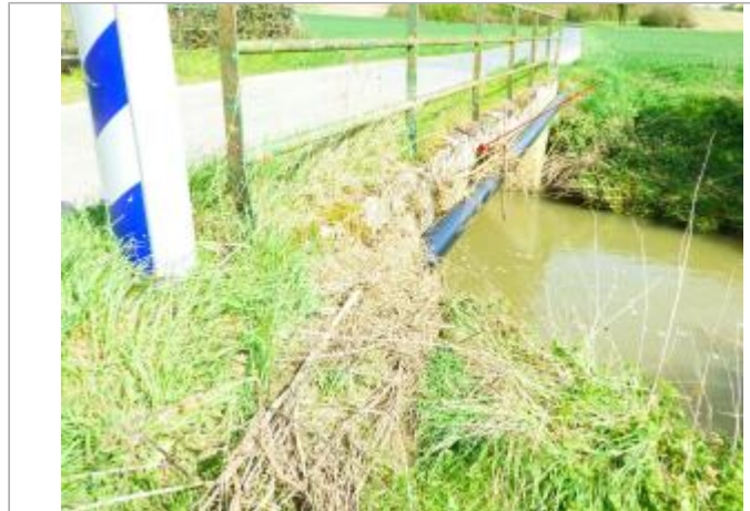
Vue site - Auteur : SPC SMYL

Coordonnées WGS84 : X: 2.90704010 / Y: 48.55258430