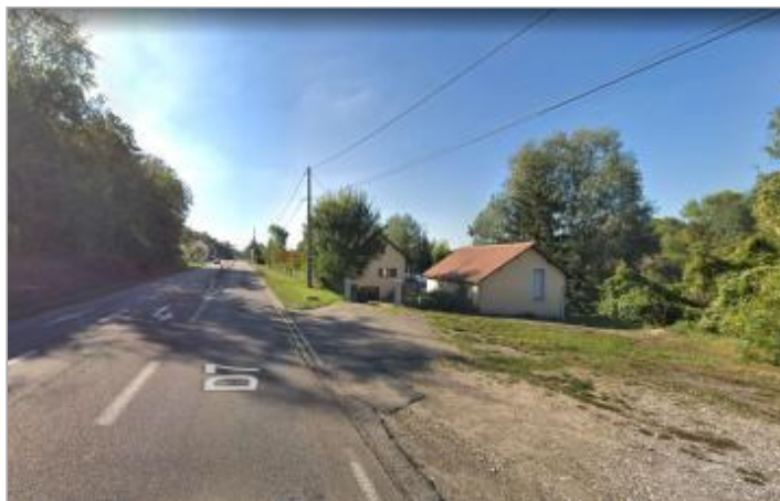
107 route d'Elbeuf

Coordonnées WGS84 : X: 1.12134740 / Y: 49.34068800