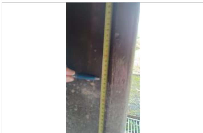
Laisse de crue à 65.5 cm/sol