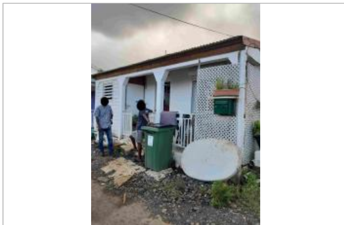
Escalier extérieur maison