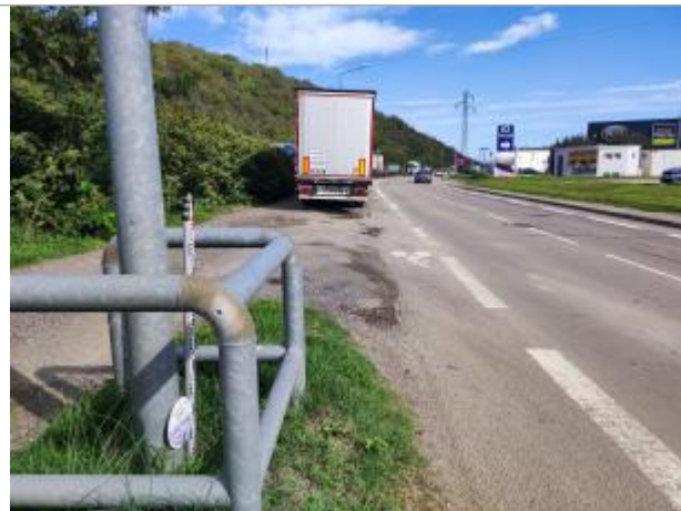
Rue de la Paix