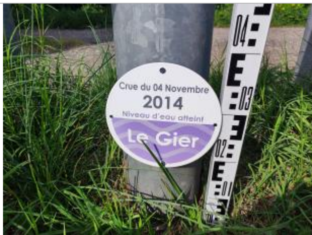
zoom sur le repère de crue posé avec une mire