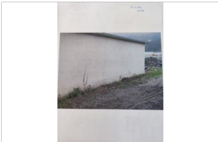
marque le garage