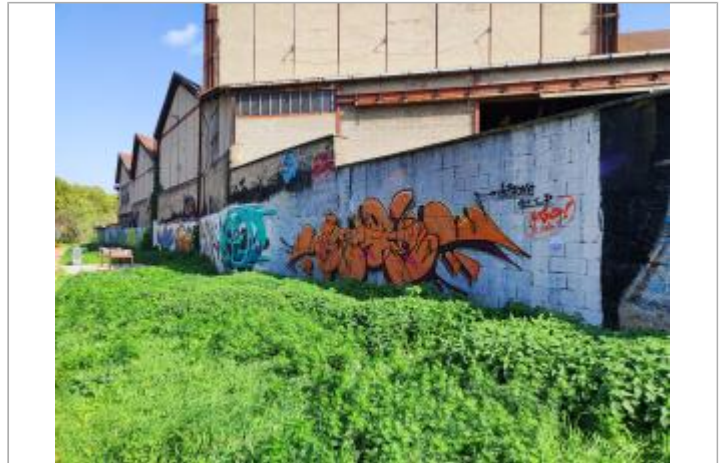
Quai eugène Souchon