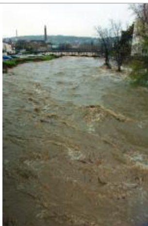
photo d'inondation sur le pont SNCF