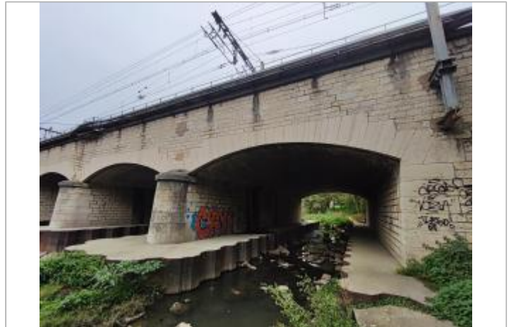
pont SNCF vue de l'aval