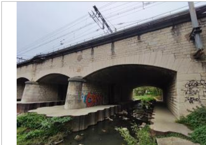
pont SNCF vue de l'aval