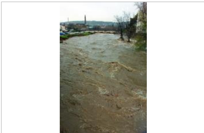
photo d'inondation sur le pont SNCF