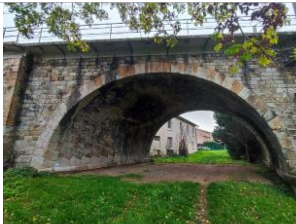
arche du pont SNCF