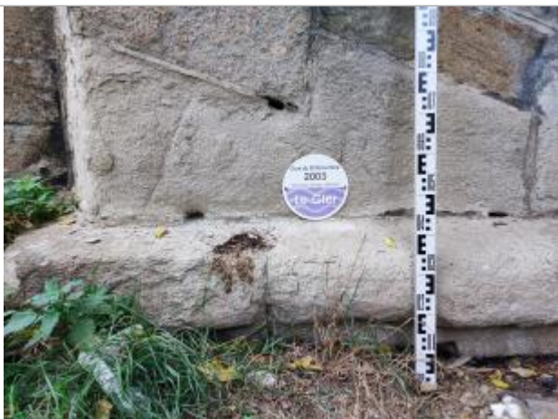
zoom sur le repère de crue posé avec une mire