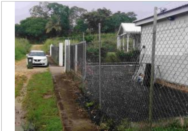
Maison individuelle Bois Rada