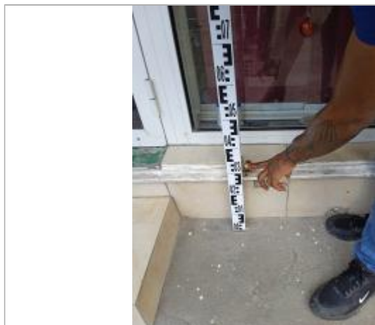
Témoignage d'une hauteur d'eau

Différence entre le niveau d'eau et la référence (en m) : 0.310 m