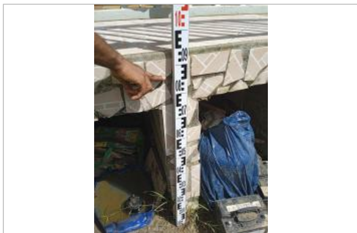
Témoignage d'une hauteur d'eau

Différence entre le niveau d'eau et la référence (en m) : 0.860 m