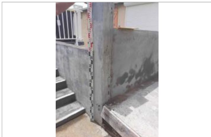
Témoignage d'une hauteur d'eau

Différence entre le niveau d'eau et la référence (en m) : 1.100 m