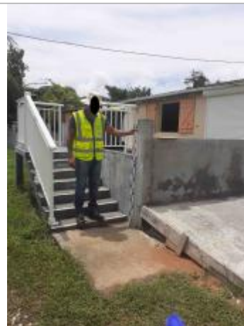
Mur de clôture en béton

Coordonnées RGF93 (ETRS89) : X: -61.60583 / Y: 16.2568331