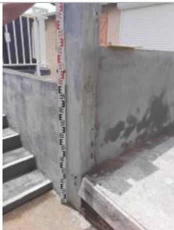
Témoignage d'une hauteur d'eau

Différence entre le niveau d'eau et la référence (en m) : 1.100 m