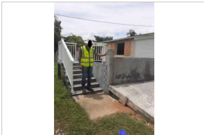
Mur de clôture en béton