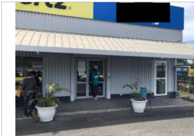
Façade extérieure du bâtiment