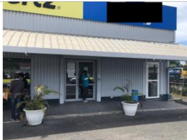
Façade extérieure du bâtiment