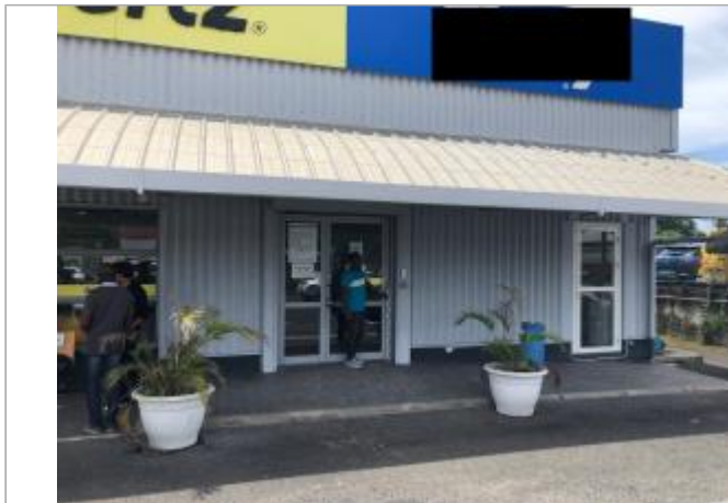
Façade extérieure du bâtiment