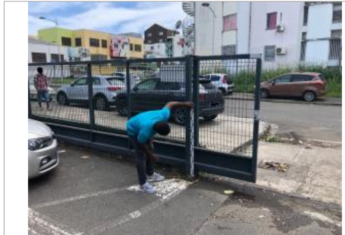
Grillage de cloture à proximité du parking