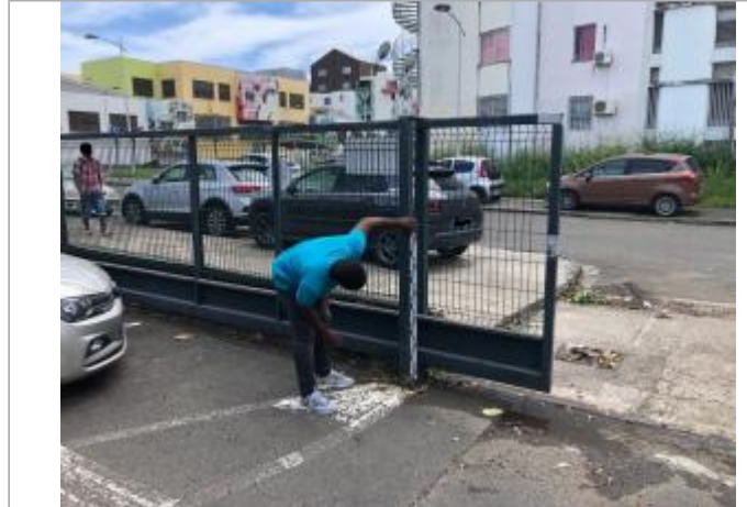
Grillage de cloture à proximité du parking