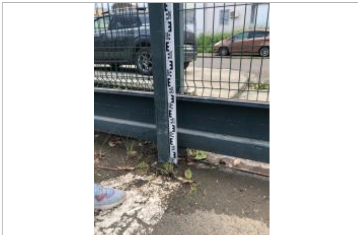
Dépôt de matières solides

Différence entre le niveau d'eau et la référence (en m) : 0.400 m