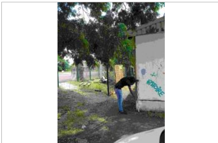
Façade extérieure du bâtiment