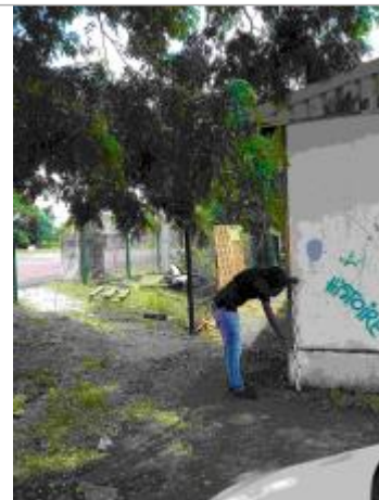
Façade extérieure du bâtiment

Coordonnées RGF93 (ETRS89) : X: -61.532087 / Y: 16.2579227