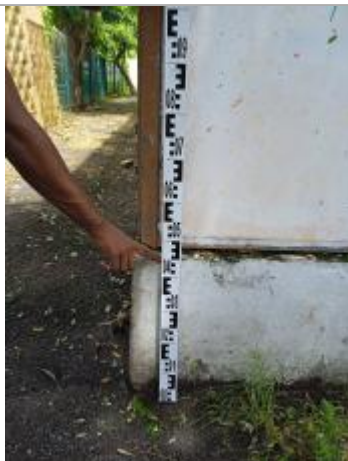
Témoignage d'une hauteur d'eau

Différence entre le niveau d'eau et la référence (en m) : 0.450 m