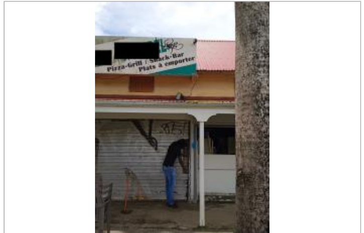
Façade extérieure du bâtiment