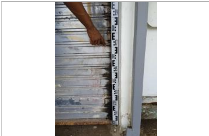
Témoignage d'une hauteur d'eau

Différence entre le niveau d'eau et la référence (en m) : 0.710 m