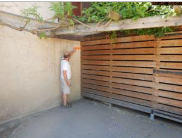
Vue du repère éloignée extérieure

Altitude calculée de l'eau (en m) : 496.982