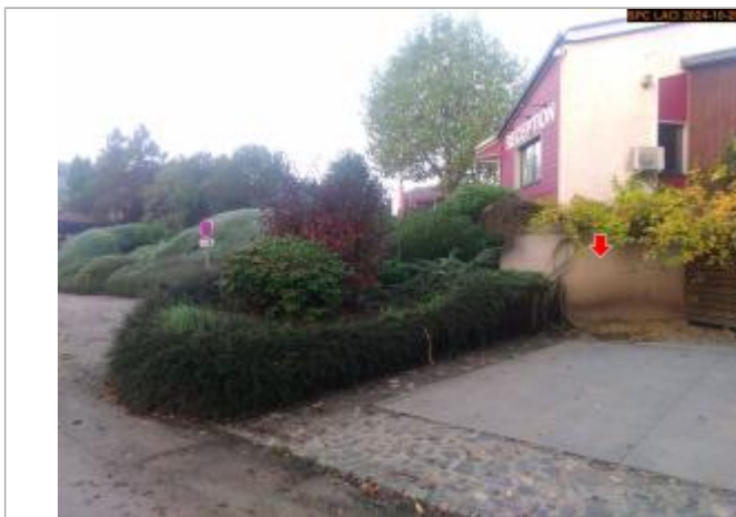
Vue éloignée, du repère en 2024

Altitude calculée de l'eau (en m) : 496.714