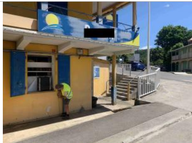
Façade extérieure du bâtiment

Coordonnées WGS84 : X: -61.76095200 / Y: 16.05967730