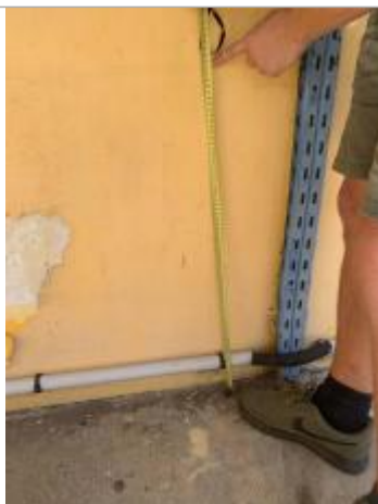
Témoignage d'une hauteur d'eau

Altitude calculée de l'eau (en m) : 20.255 m