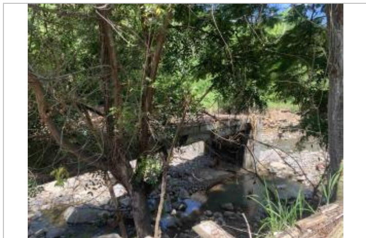
Ouvrage de franchissement partiellement détruit