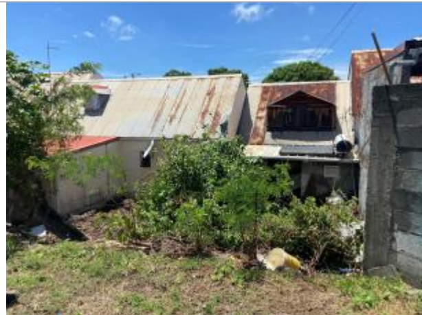
Jardin de la maison en contrebas