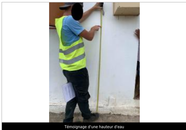
Témoignage d'une hauteur d'eau

Altitude calculée de l'eau (en m) : 6.144