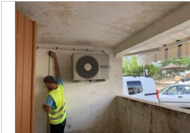
Terrasse extérieure de la maison