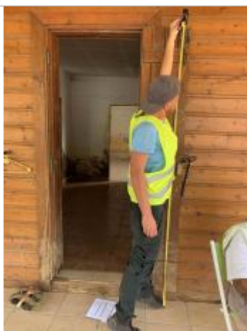
Dépôt de matières solides