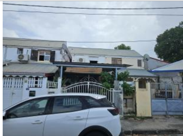
Vue depuis la route

Coordonnées WGS84 : X: -61.74542100 / Y: 16.00997730