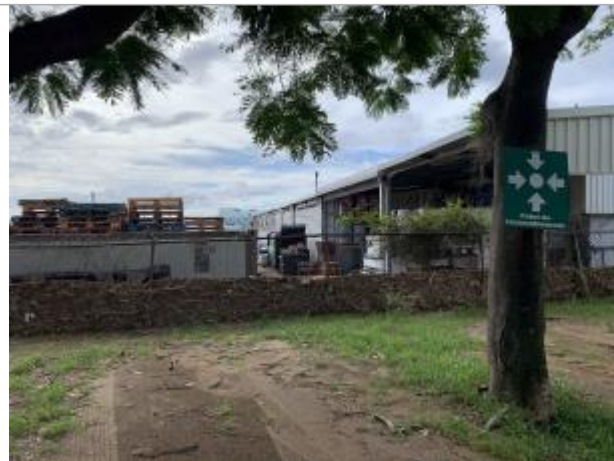
Grillage de clôture à proximité du parking