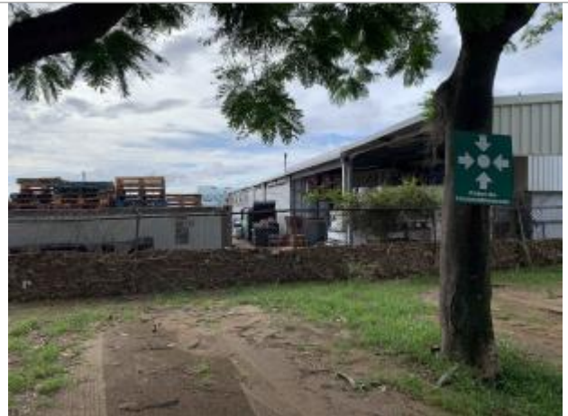
Grillage de clôture à proximité du parking

Coordonnées WGS84 : X: -61.74350800 / Y: 16.01200650