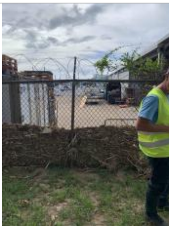
Dépôt de matières solides

Altitude calculée de l'eau (en m) : 9.941 m