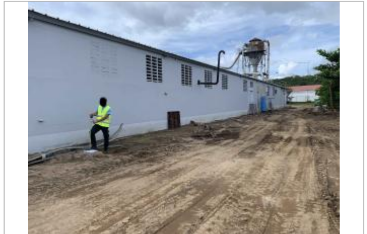
Façade extérieure du bâtiment