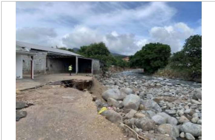
Erosion de 3-4 mètres de la berge