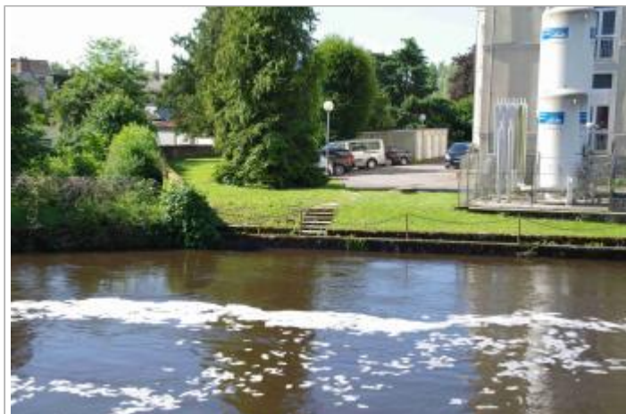
Vue d'ensemble des escaliers.