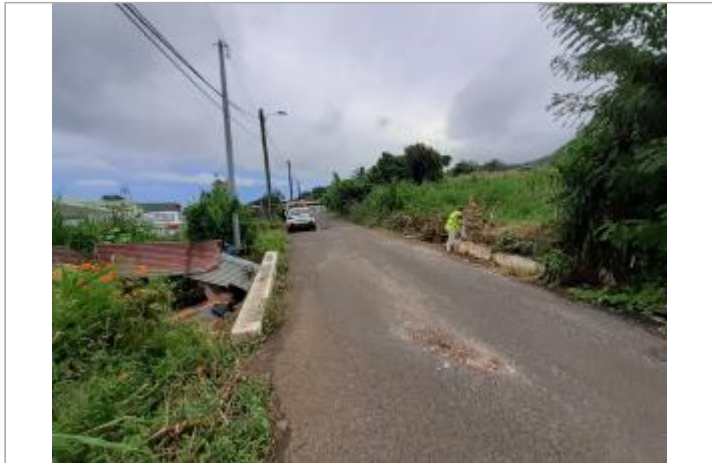
Pont en charge