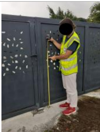
Dépôt de matières solides