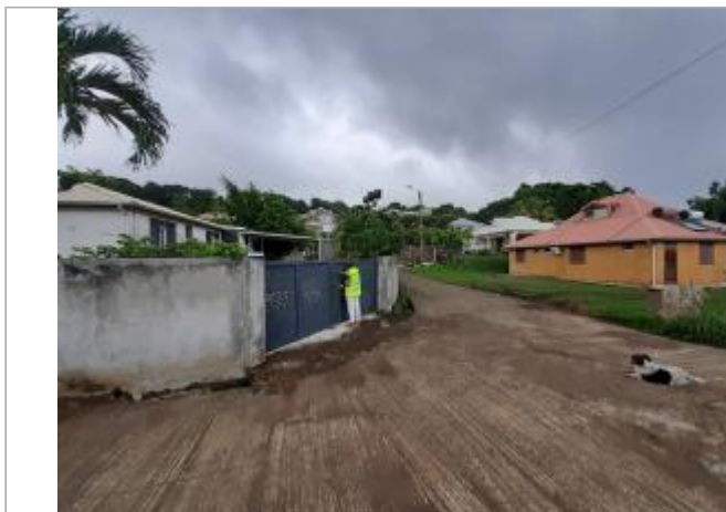
Portail de clôture

Coordonnées WGS84 : X: -61.65103400 / Y: 15.98024630