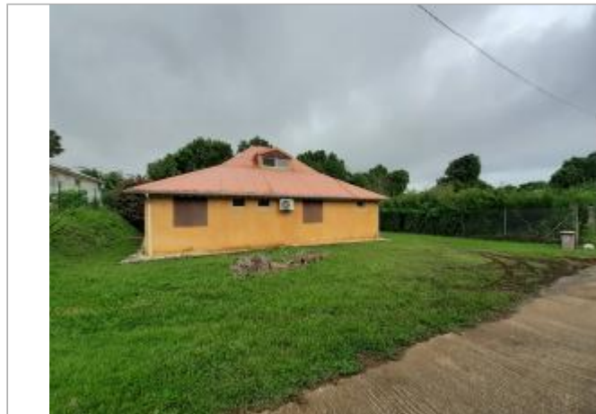
Façade extérieure du bâtiment

Coordonnées WGS84 : X: -61.65088400 / Y: 15.98033660