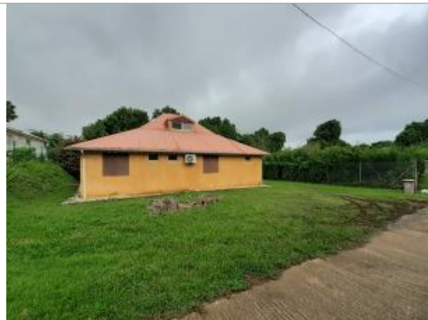
Façade extérieure du bâtiment