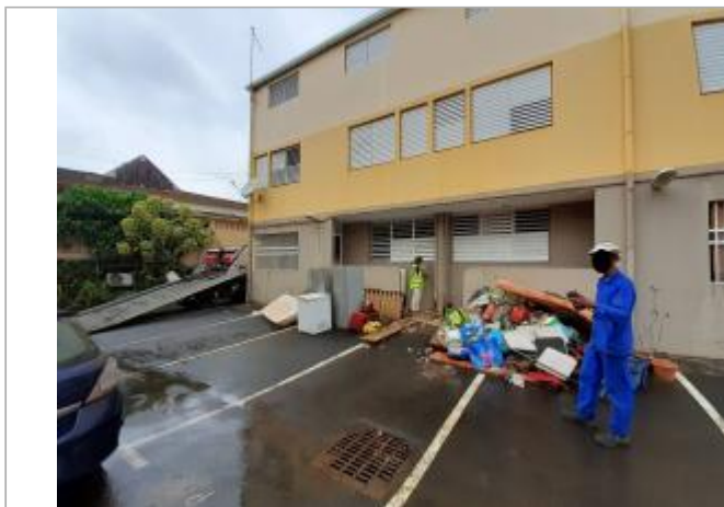
Façade extérieure du bâtiment

Coordonnées RGF93 (ETRS89) : X: -61.645189 / Y: 15.9757069