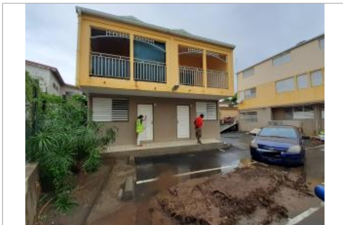
Façade extérieure de la maison